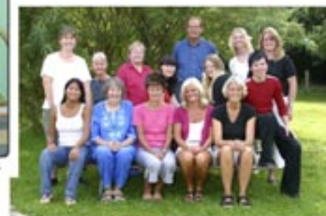
Sensommer Søndag 2005